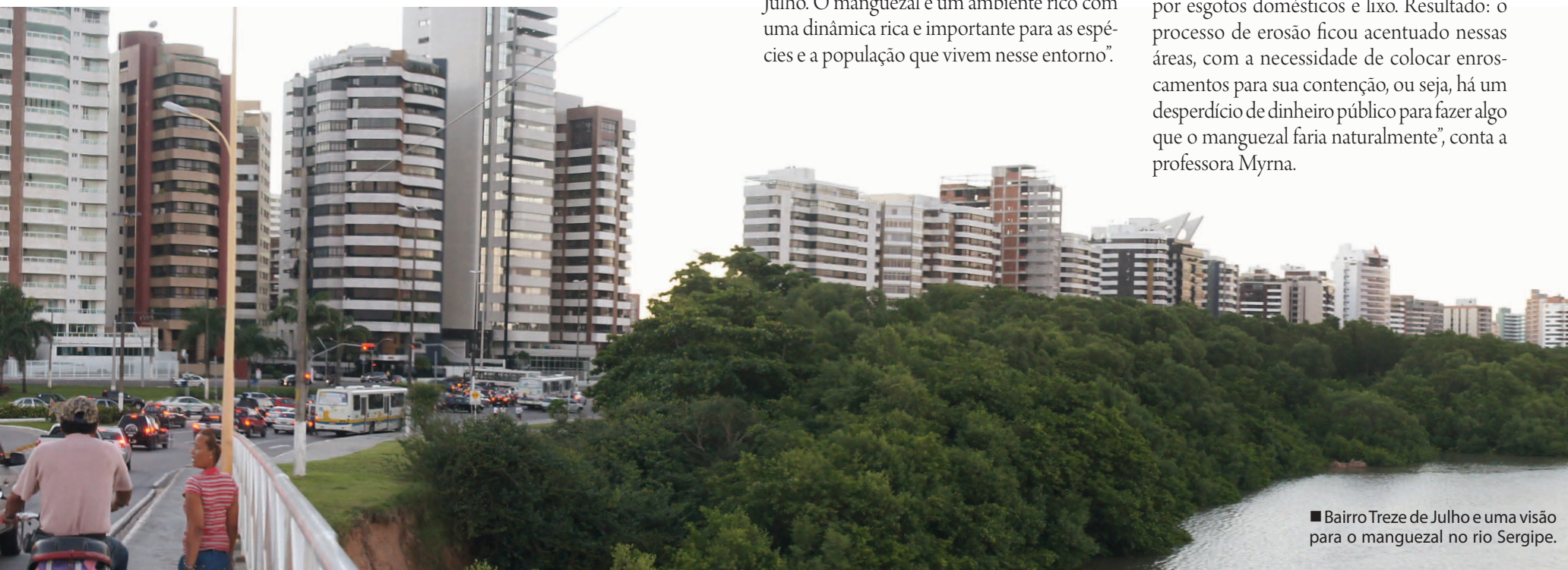
■ Bairro Treze de Julho e uma visão para o manguezal no rio Sergipe.