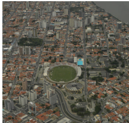
Adail Pedross Rosa

■ Vista do Batistão na década de 1970. Abaixo, foto atual do estádio, rodeado de povoações